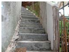
Albertturm auf Collm bleibt weiter gesperrt