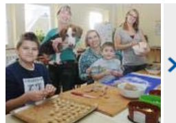
Oschatzer E-Werk will mehr Kraft seine Freizeitangebote