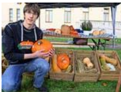
Kürbisse aus Tansania wachsen in Sitzenroda